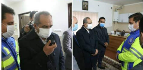
در دهه مبارک فجر؛