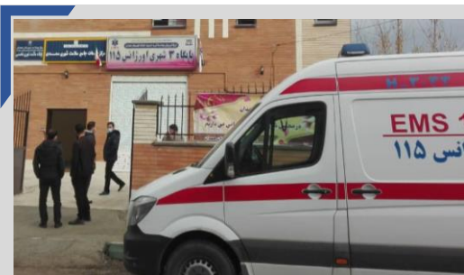
در دهه مبارک فجر صورت پذیرفت؛