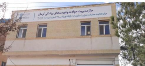
در هشتمین روز از دهه فجر صورت گرفت؛